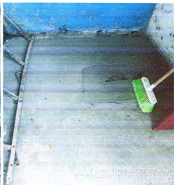
Figura N°7. Poza séptica.