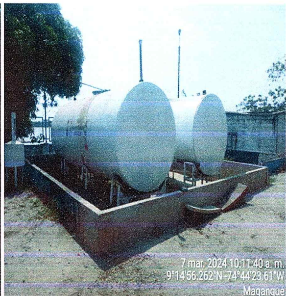
Figura N°5. Tanques de almacenamiento.