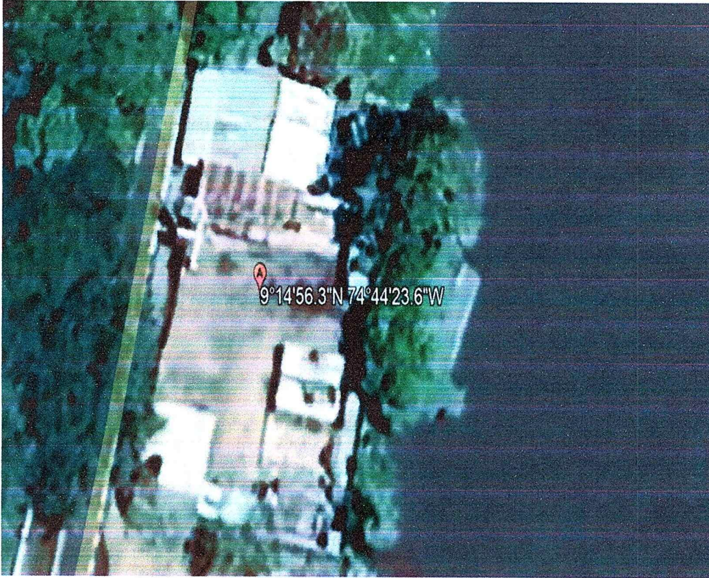
Figura N1. Imagen Google Earth