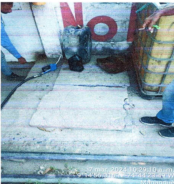
Figura N°6. Trampa de grasas