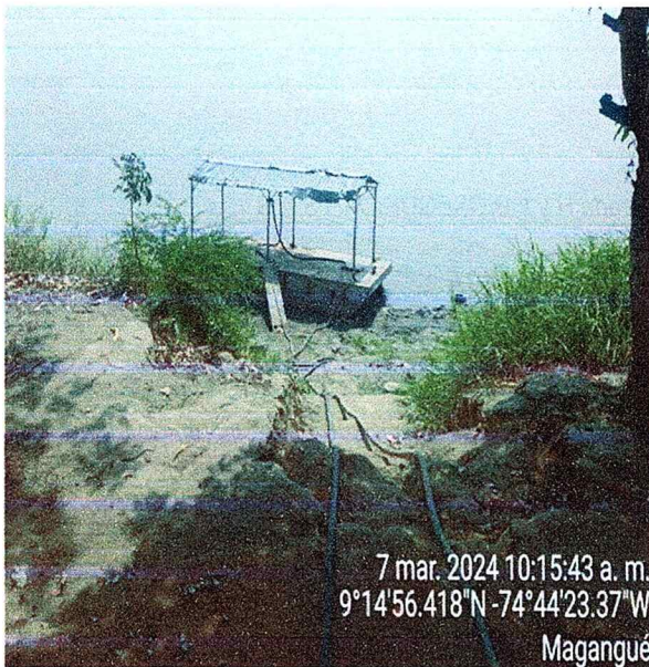
Figura N°4. Isla fluvial y manguera.